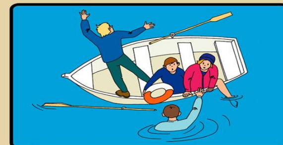
ПОДНИМАЙТЕ ТОНУЩЕГО ИЗ ВОДЫ ТОЛЬКО С КОРМОВОЙ ЧАСТИ СПАСАТЕЛЬНОГО СРЕДСТВА !